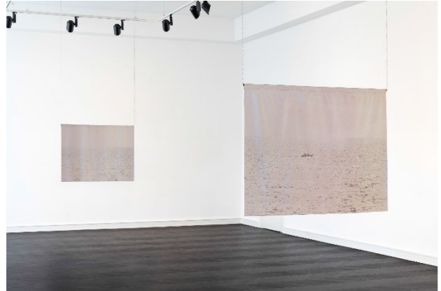
I'm Youssef, 6 months 2021, 100 x 75 cm Siebdruck einer Fotografie auf Textil

Ausstellungsansicht Museum für Fotografie Berlin Installationsansicht: CHROMA