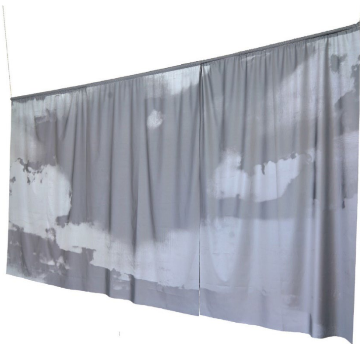
Sky over a boat in distress 2021, 146 x 314 cm Siebdruck einer Fotografie auf Textil